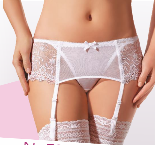
No 032 s m l xl